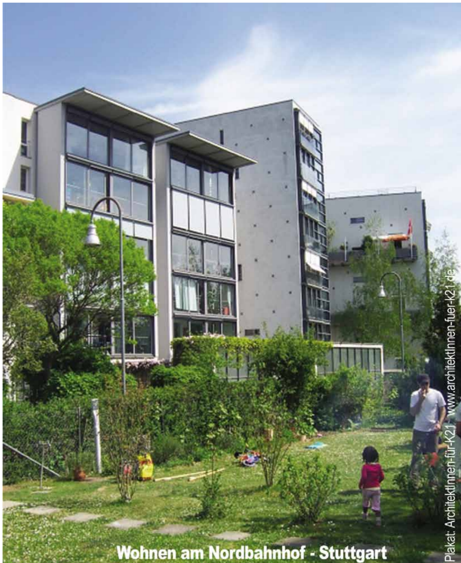
Wohnen am Nordbahnhof - Stuttgart

Da das Projekt Kopfbahnhof 21 deutlich günstiger als Stuttgart 21 sein wird, stehen die bereits freigewordenen Grundstücke auf der Teilfläche C unter einem geringeren Vermarktungsdruck und können deutlich günstiger angeboten werden. Das eröffnet den Raum für vielfältige Bau und Wohnformen, wie Baugemeinschaften, Familien, soziales Wohnen, Wohnen im Alter usw. in Nachbarschaft. Eine Vermeidung zu großer Grundstücke und die Parzellierung derselben schafft übersichtliche Hausgemeinschaften und fordert den Gedanken der Nachbarschaft.