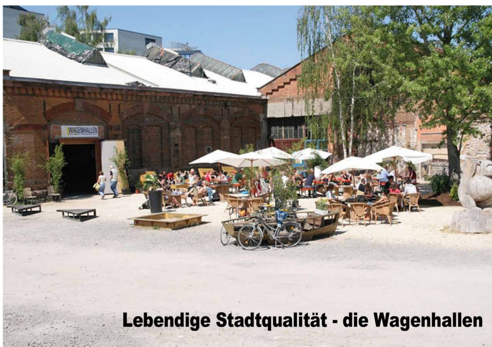
Lebendige Stadtqualität - die Wagenhallen

Was diese Quartiere bestimmt, ist eine hohe Qualität des öffentlichen Raumes, eine Nutzung, statt eines reinen Wohngebietes, und verträgliches Gewerbe im Erdgeschoss, soziale Vielfalt und die Aufteilung von Grund und Boden in kleinere Einheiten die Parzelle.