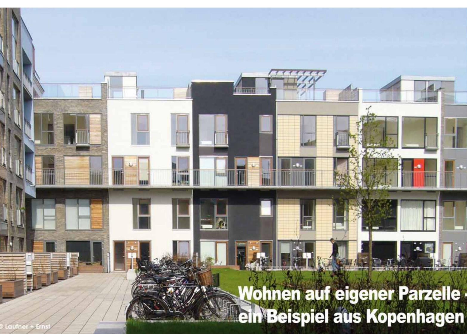
Wohnen auf eigener Parzelle – ein Beispiel aus Kopenhagen